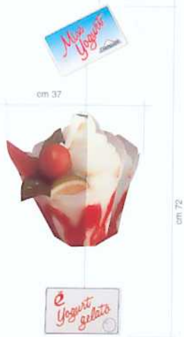
DREIDIMENSIONALES MEDAILLON JOGHURT

Code-Nr. 757900074 - zum Charakterisieren des mit der Softeis-Produktion betrauten Personals.