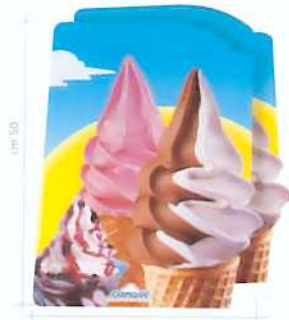
DOPPELSEITIGE ROTERS SOFTEIS